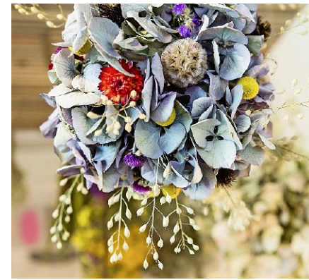
Blumen aus der Blumerei.