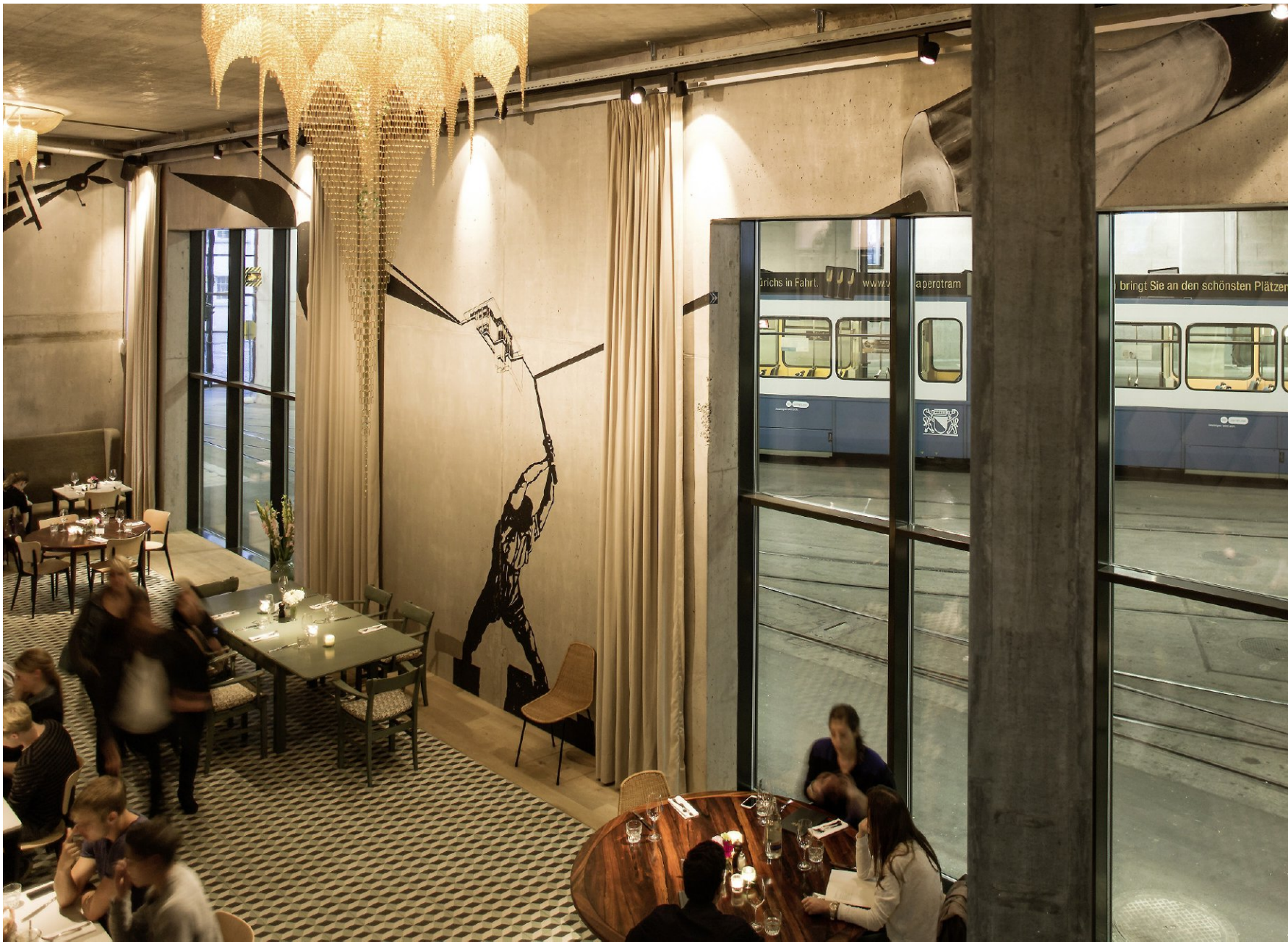
Das Bebek in der Genossenschaft Kalkbreite ist nicht nur wegen der Trams so attraktiv.