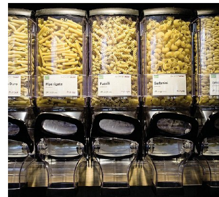
Teigwaren zum Abfüllen.